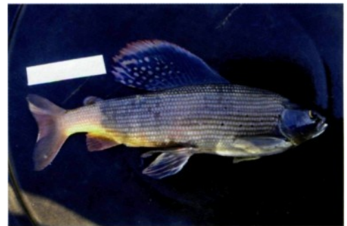
... und über Wasser