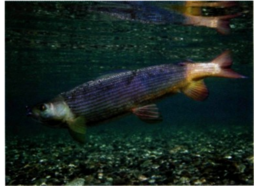
Prächtig gefärbte Gelbschwanz-Äschen, unter...

Wir interessieren uns aber besonders für seine Fischfauna. Neben Lenok, Renken, Aalrutte, Barsch und Rotaugen kommt nur hier die bereits vorgestellte Hubsgul-Äsche vor; die Ausbildung von endemischen Arten ist ein typisches Merkmal alter Seen. Diese Äschenform hat sich aus der Arktischen Äsche entwickelt, wird aber von den meisten Autoren als eigene Art geführt. Sie unterscheidet sich