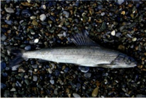
Hubsgul-Äsche ( Thymallus nigrescens )

ten Norden (siehe Karte, gelbe Fläche): Das sogenannte Darhat-Becken entwässert nicht über das Selenge-Baikalsee-Angara-System in den Jenissej, sondern bildet die unmittelbare Quellregion des Kleinen Jenissej. Die Äschen hier zeichnen sich unter anderem durch eine besondere Färbung aus - ihr Schwanzansatz ist gelb. Diese Form wurde bisher zur Arktischen Äsche gezählt. Wie vorläufige Untersuchungen zeigen, steht sie aber der Mongolischen Äsche näher und wäre möglicherweise als eigene Art zu führen.