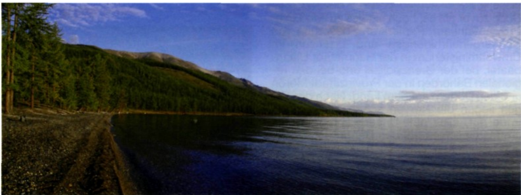
Unberührtes Westufer des glasklaren Hubsugul-Sees

reichen, fehlen die Raubfische Taimen und Lenok; deshalb hat sich hier eine vierte Äschenart als Top-Prädator entwickelt, die Mongolische Äsche ( Thymallus brevirostris ). Sie nimmt die ökologische Nische als Raubfisch am Ende der Nahrungskette ein und ist überaus großwüchsig. In der wissenschaftlichen Literatur werden Endlängen bis 75 cm beschrieben, aber auch Angaben von bis zu 1 m Länge geistern durch die Literatur... All diese Äschenarten sind seit langem bekannt und beschrieben. Weniger Klarheit herrscht in der Wissenschaft über die Äschen in einem kleinen Teil-Einzugsgebiet im außers-